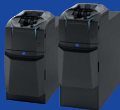
GLR-100 електронний касир