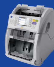
USF-50/USF-50S міні-сортувальник банкнот