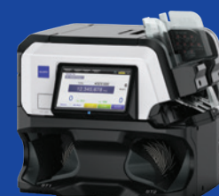
USF-200 сортувальник банкнот