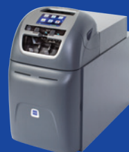
Vertera™ 6G електронний касир