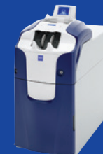
RBG-100G1 електронний касир