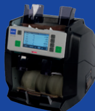
GFS-220 міні-сортувальник банкнот