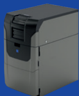
GDB-100 депозитне рішення