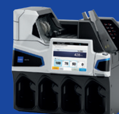
UW-F Series сортувальник банкнот