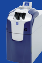
RBG-200 електронний касир