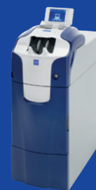
RBG-100AB електронний касир