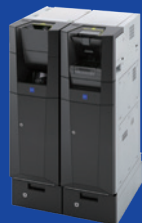
CI-10 рециркулятор банкнот і монет