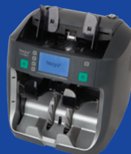
Ntegra™ Compact міні-сортувальник банкнот